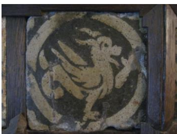
Pavés du Molay, XIV ème siècle.

L'activité, prévue sur une durée de deux heures, comprend :